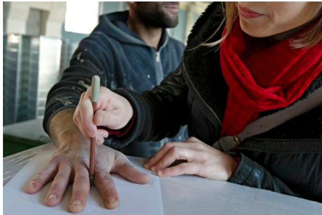
Kasia Ozga « Musée de l'Homme, Dessins de Poussière »

Son projet Dessins de Poussière s'articule autour de la prise d'empreintes des mains des ouvriers du chantier pour obtenir un gabarit qui contribuera à obtenir, avec l'aide de colle, le dessin de mains sur les murs du chantier par l'accumulation de poussière, faisant écho aux empreintes de mains négatives de la Préhistoire et imprimant dans les murs du futur musée les mains de ceux qui ont contribué à le construire.