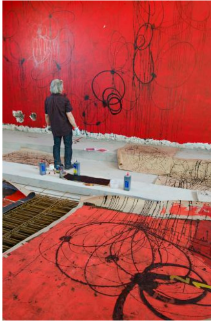
Alain Cardenas-Castro « Musée de l'Homme in situ »